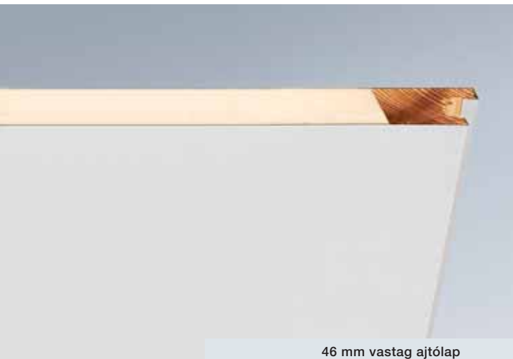
46 mm vastag ajtólap