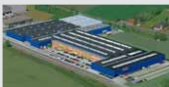
Hörmann KG Werne