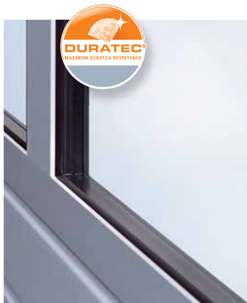
Új 26 mm vastag üvegezés