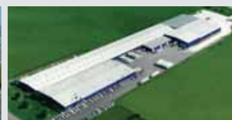
Hörmann LLC, Montgomery IL, USA

A nemzetközi piacon egyedülállóan a Hörmann cég az, amely a fontosabb nyílászárók teljes palettáját kínálja. A termékeket szakosodott gyáregységekben, a legújabb műszaki megoldásokat alkalmazva gyártják. A sűrű európai értékesítési- és szervizhálózatnak, továbbá az amerikai és kínai képviseletnek köszönhetően mindenütt az Önök megbízható, nemzetközi partnerei vagyunk a nyílászárók piacán. Jelszavunk: Minőség kompromisszumok nélkül.