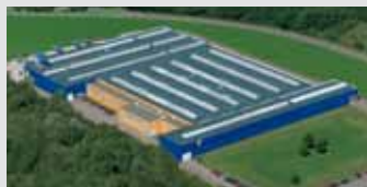
Hörmann KG Eckelhausen