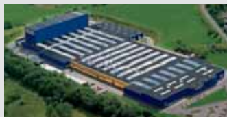
Hörmann KG Freisen