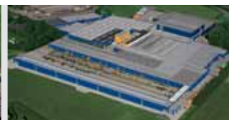
Hörmann KG Brockhagen