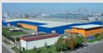
Hörmann Beijing, China