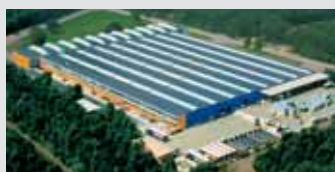
Hörmann Genk NV, Belgien