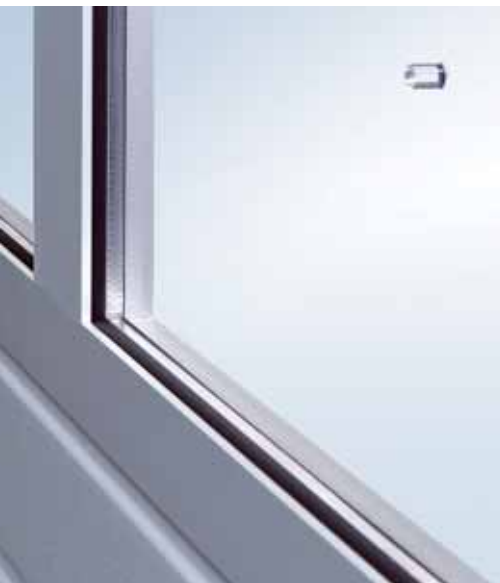
Eddigi üvegezés távtartóval