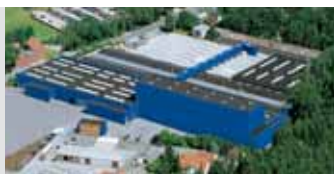
Hörmann KG Amshausen