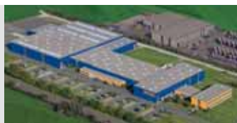
Hörmann KG Antriebstechnik