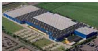
Hörmann KG Brandis