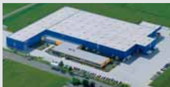
Hörmann KG Dissen